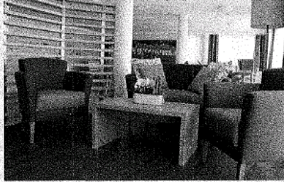
Freundliches Ambiente in der Seniorenresidenz Wiesmoor

In der hauseigenen Küche wird für die Bewohner täglich frisch gekocht und gebacken. Ein kompetentes Pflegeteam sorgt für eine professionelle Pflege, ergänzt wird es durch ein Betreuungsteam, um dadurch das Angebot der Tagesaktivitäten zu bereichern. Gemeinsam plant und gestaltet das Team den Alltag und die Arbeitsabläufe. Nach dem Motto „nur gemeinsam sind wir stark“ können sich interessierte Pflegekräfte bei der Seniorenresidenz bewerben, um sich hier in den einzelnen Arbeitsbereichen zu engagieren. Zum besseren Kennenlernen wird am 8. Oktober 2017 in der Zeit von 11 bis 17 Uhr ein „Tag der offenen Tür“ veranstaltet. An diesem