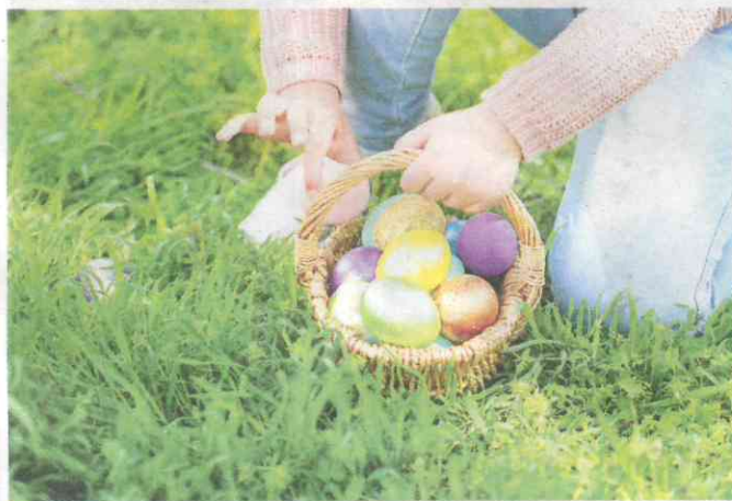
Die Alloheim Senioren-Residenz „An der Elbe“ veranstaltet eine Oster-Malaktion für Kinder.

Osterhase sucht kleine Künstler im Alloheim